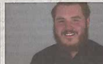
Leon Hoffmann Teile & Zubehör