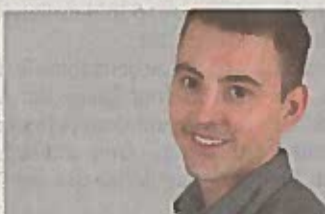
Johann Saganovich Teile & Zubehör